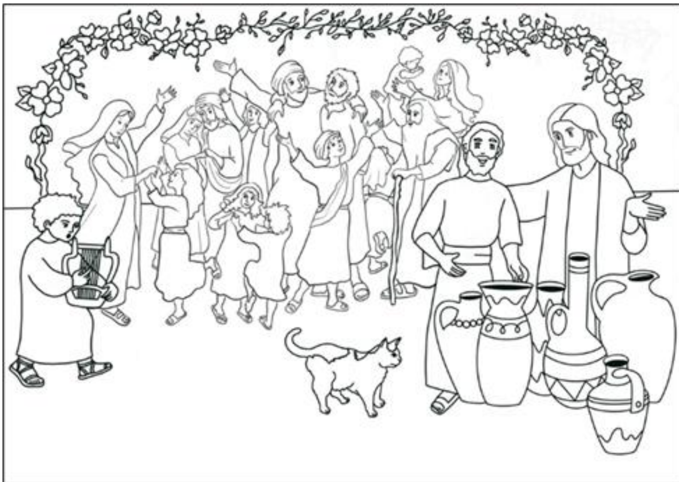
Les Noces de Cana, d'après l'évangile de Jean 2, 1-10

« Il y avait un mariage à Cana, en Galilée.