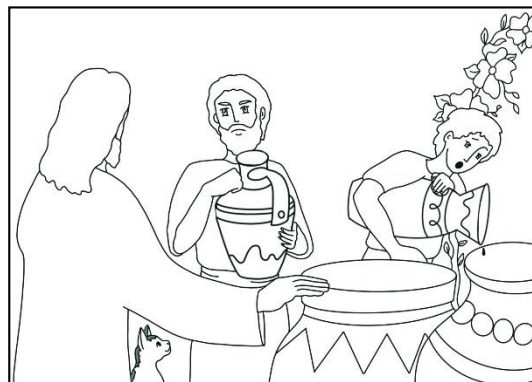
Les Noces de Cana, d'après l'évangile de Jean 2, 1-10

« Il y avait un mariage à Cana, en Galilée.