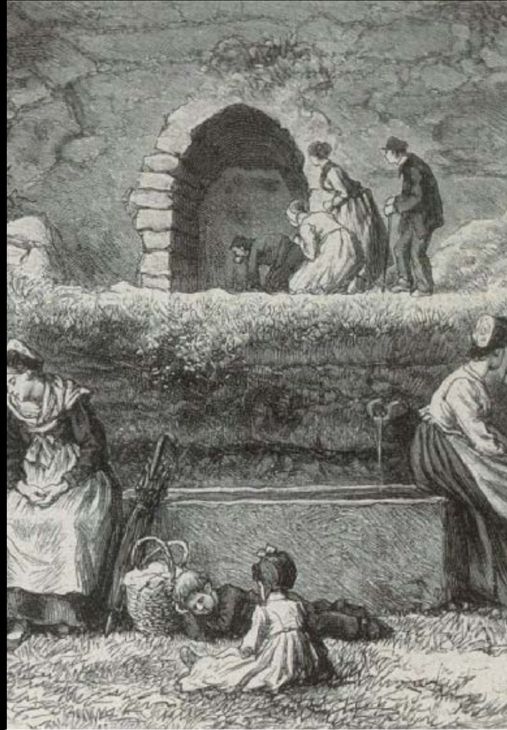
PÈLERINS À LA SOURCE DU MONT STE ODILE (19E SIÈCLE)