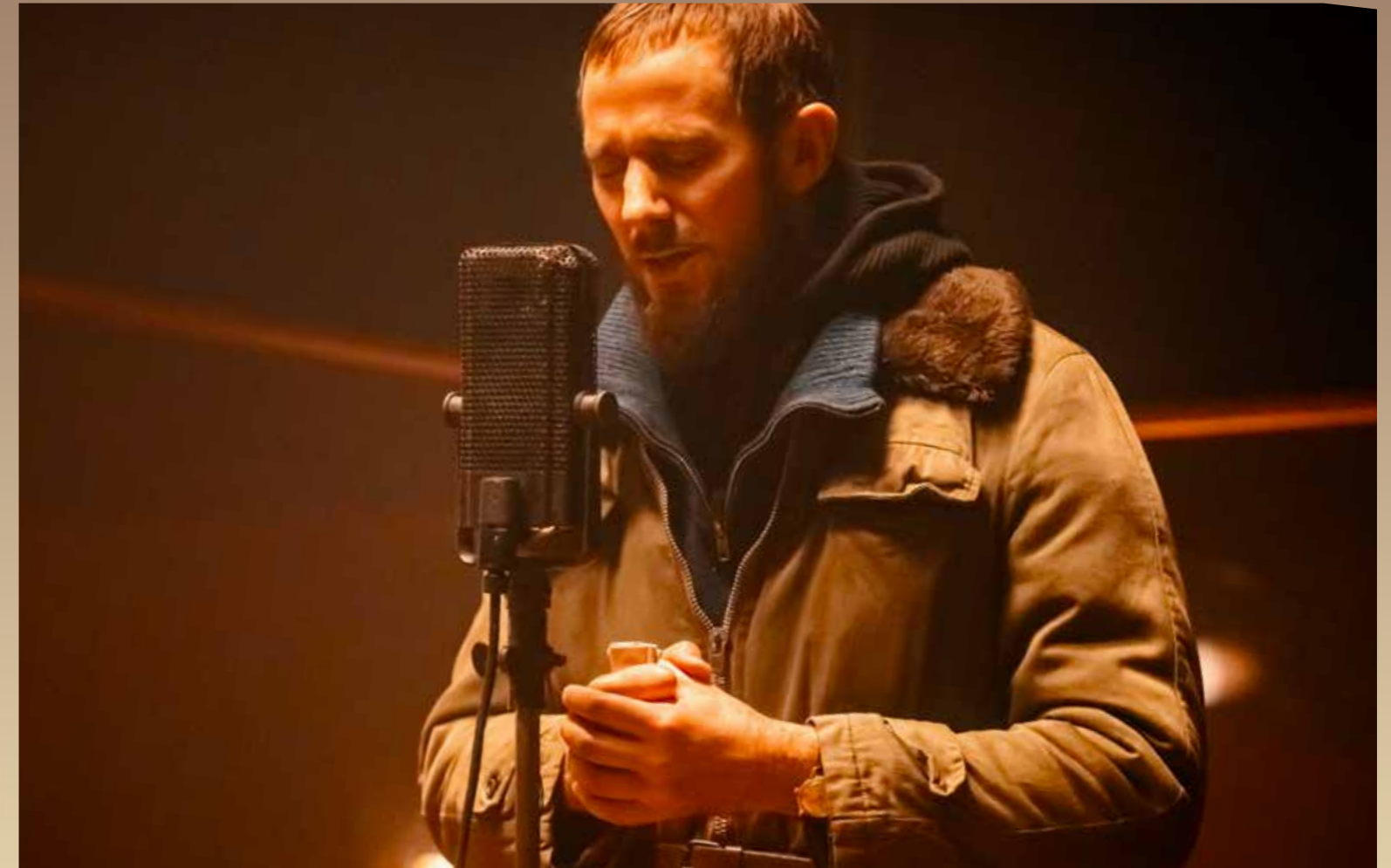
L'abbé Pierre lançant son appel au micro de RTL, dans le film