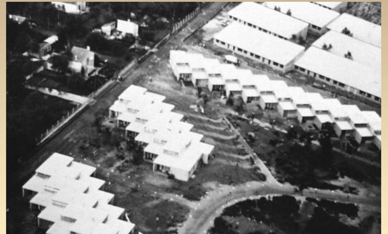
Les premières H.L.M.