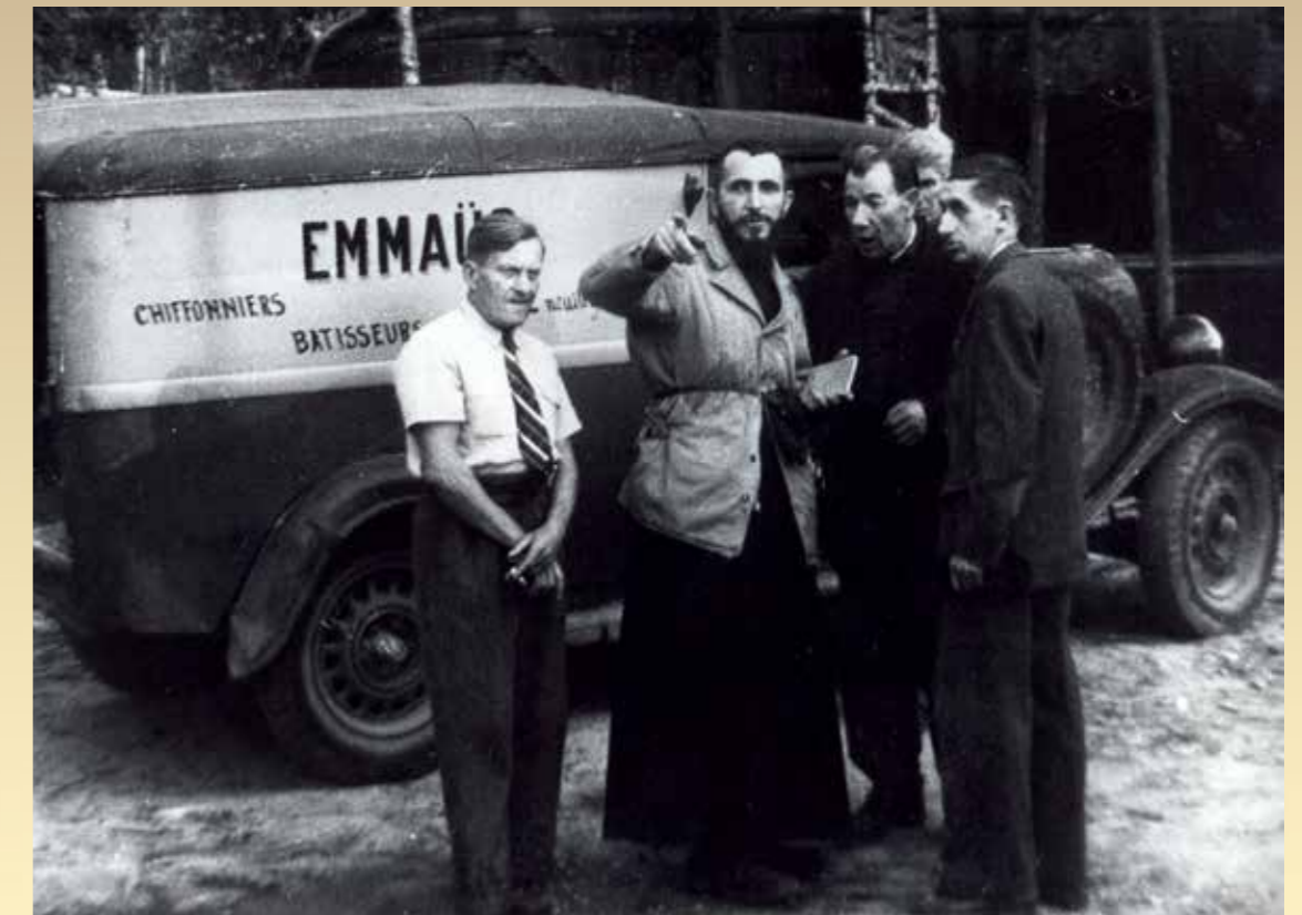
Neuilly-Plaisance, la première communauté d'Emmaüs