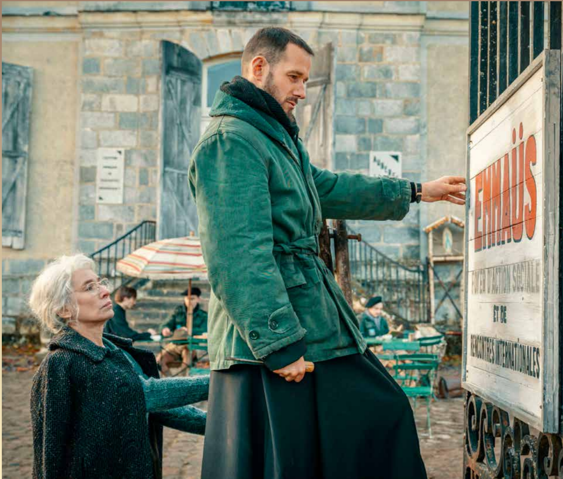
La fondation d'Emmaüs, dans le film