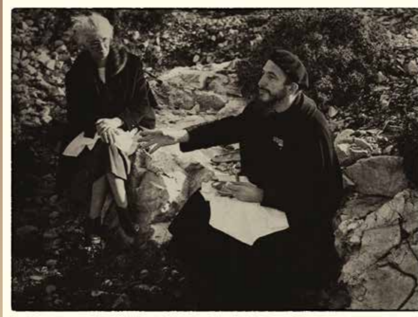
L'abbé Pierre et Lucie Coutaz

L'abbé Pierre lance un appel à l'aide sur RTL