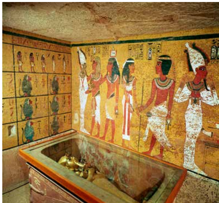
PHOTO DE LA TOMBE