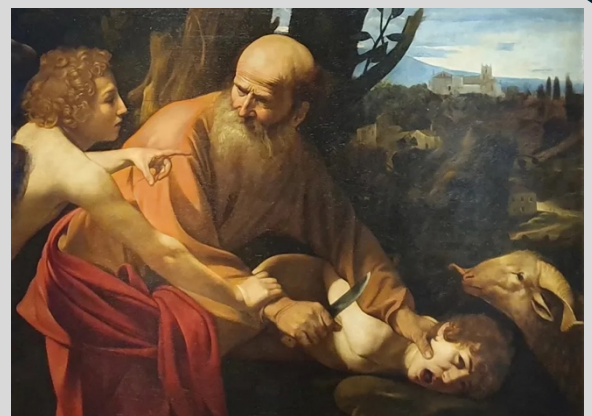
Le sacrifice d'Isaac – Le Caravage - 1603

(D'ailleurs les versets 15-18 font résonner une nouvelle fois la promesse de Dieu à Abraham de devenir un grand peuple : sa descendance sera une bénédiction pour tous les peuples de la terre ! Isaac, n'est pas mort. Mais il n'est plus mentionné ici, il reviendra plus tard dans le récit.)